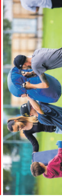
LTZBURG DUCKS/ MÜLLER