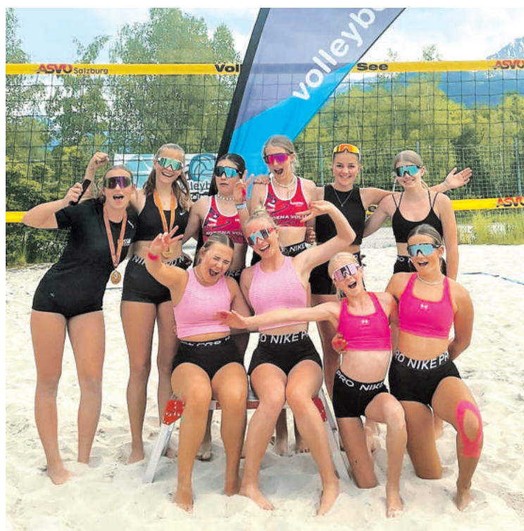
Gute Laune bei diesen Beachvolleyballteams, die an den Volleyboi Cups 2024 des ASVÖ Salzburg teilgenommen haben.