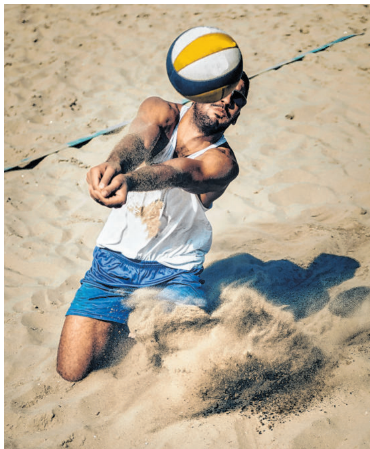
Durch die Belastung vieler Muskelpartien fördert Beachvolleyball das Herz-Kreislauf-System wie kaum eine andere Sportart.

ASKÖ Zitronenradler Naturtrüb/Volleyball Tel.: +43 677 / 620 249 55 ZITRONENRADLERNATURTRUEB @GMAIL.COM